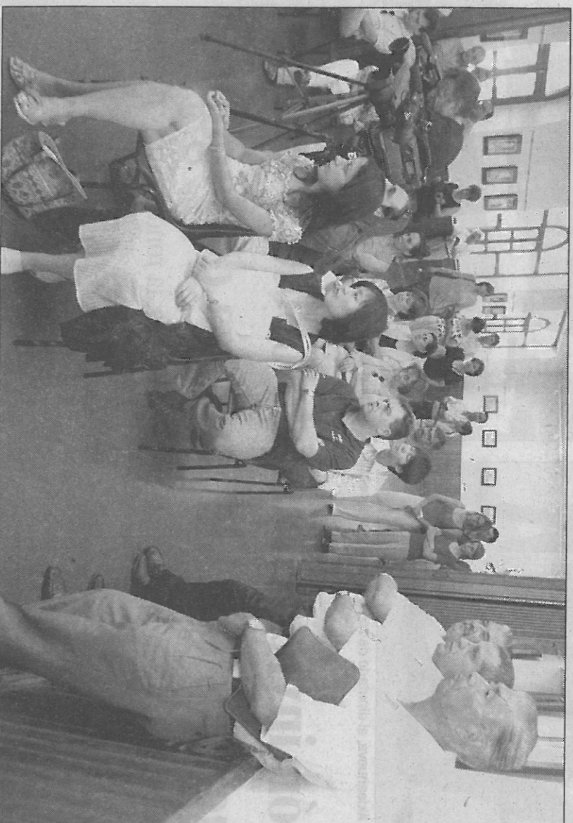
El público asistente disfrutó con la inauguración de la Semana Cultural de Japón y su exposición de grabados

La Semana Cultural incluye la proyección al aire libre de dos películas japonesas 'Bajo la aurora boreal' y 'El verano de Kikukiro' y concluirá con una ceremonia del té, uno de los actos más esperados e impactantes, que, será la estrella del programa, junto a la representación teatral, el día 9 de julio, de 'La Vida es Sueño' a cargo de la compañía japonesa KSEC.