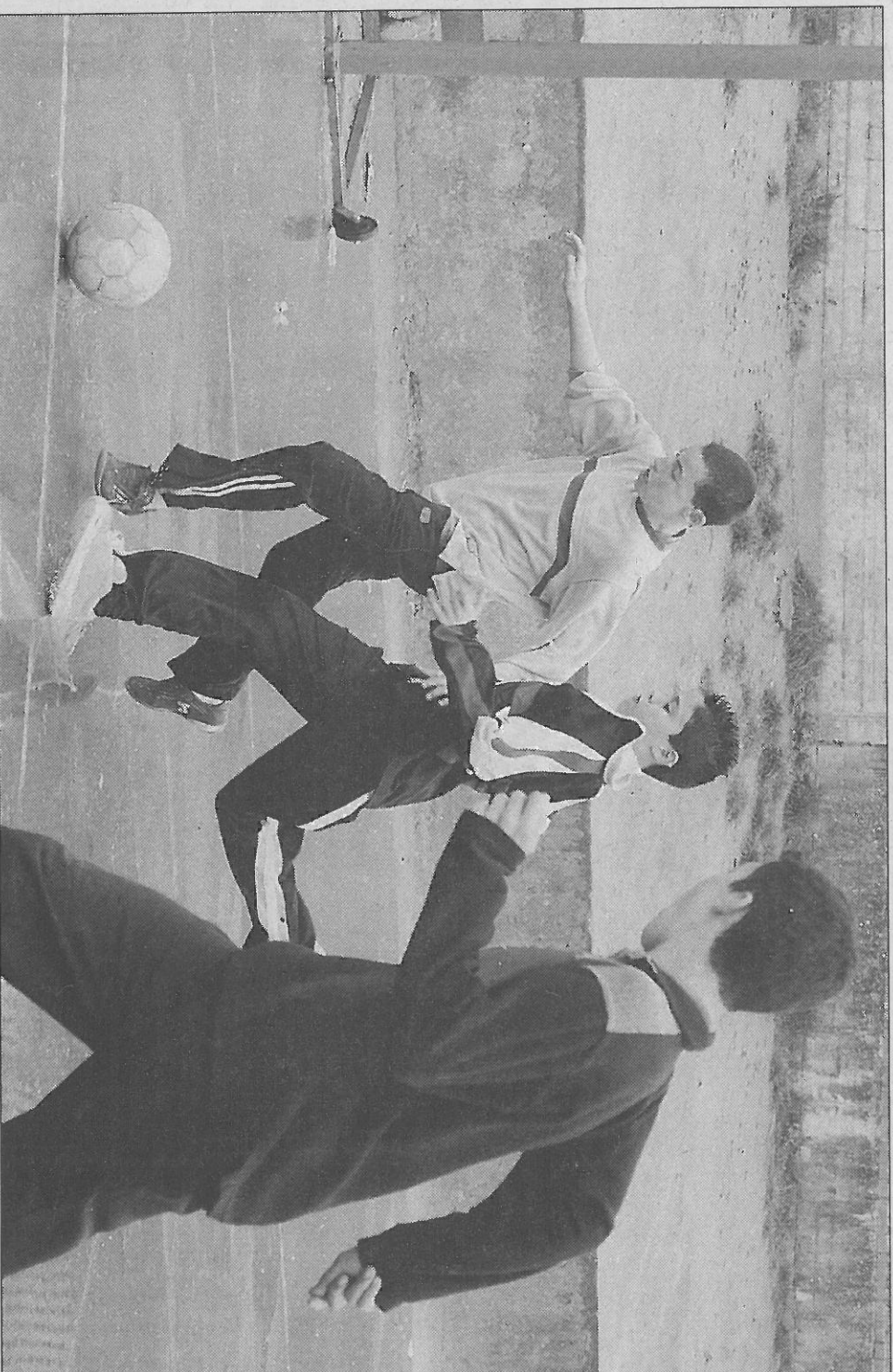
Dos alumnos del Colegio Piedra de Arte, en un encuentro de fútbol, pugnan por hacerse con el balón.

Además, y como no podía ser de otra manera en este centro de Villamayor de Armuña, “el deporte está muy valorado, tanto desde la dirección como desde el Ayuntamiento, y más en la actualidad, puesto que cada vez son más los monitores que se suman a este proyecto deportivo de los juegos escolares y los alumnos se implican desde más pequeños”.